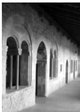
Nella foto: il chiostro di San Francesco a Cividale.

Gli obituari o necrologi o, secondo la terminologia dell'epoca in cui furono allestiti – opportunamente adottata anche da Scalon –, libri degli anniversari negli ultimi anni hanno destato un certo interesse presso chi si occupa di storia medievale, anche perché in molti casi costituiscono l'unica o la più completa fonte disponibile sulla vita di una certa comunità. Si tratta di libri manoscritti organizzati come un'agenda moderna di grande formato» (così lo stesso Scalon a p. 47), dunque strutturati secondo l'ordine del calendario in modale che a ciascuna giornata sia dedicato un certo spazio della pagina. Li giorno dopo giorno, anno dopo anno e addirittura secolo dopo secolo si stratificano le annotazioni: nomi di defunti, per lo più completi di soprannomi, patronimici o matronimici,