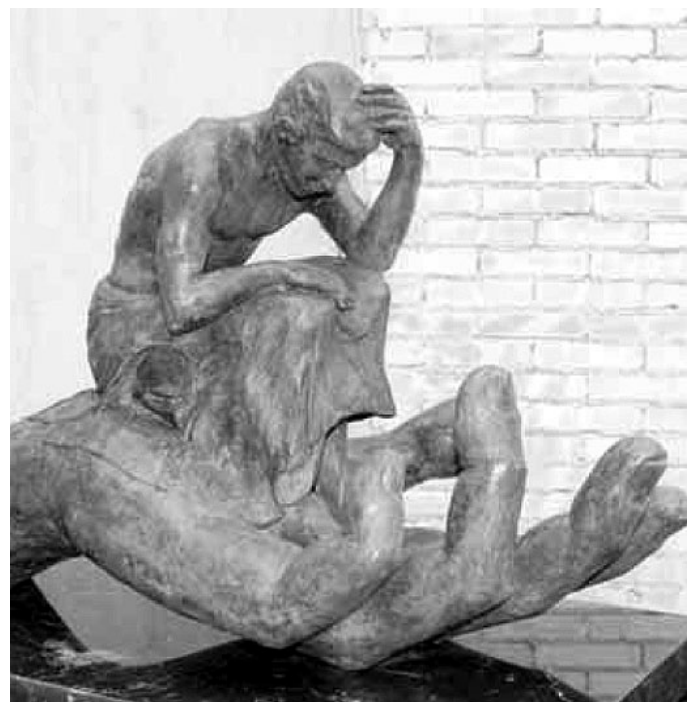
Nella foto: «La mano di Dio», scultura di Lorenzo Quinn.

«Ormai sono 25 anni che lavoro come artista. A scuola disegnavo moltissimo, c'era tantissima arte dove vivevamo, anche mio padre faceva scultura e pittura. Per parecchi anni abbiamo vissuto a Roma e